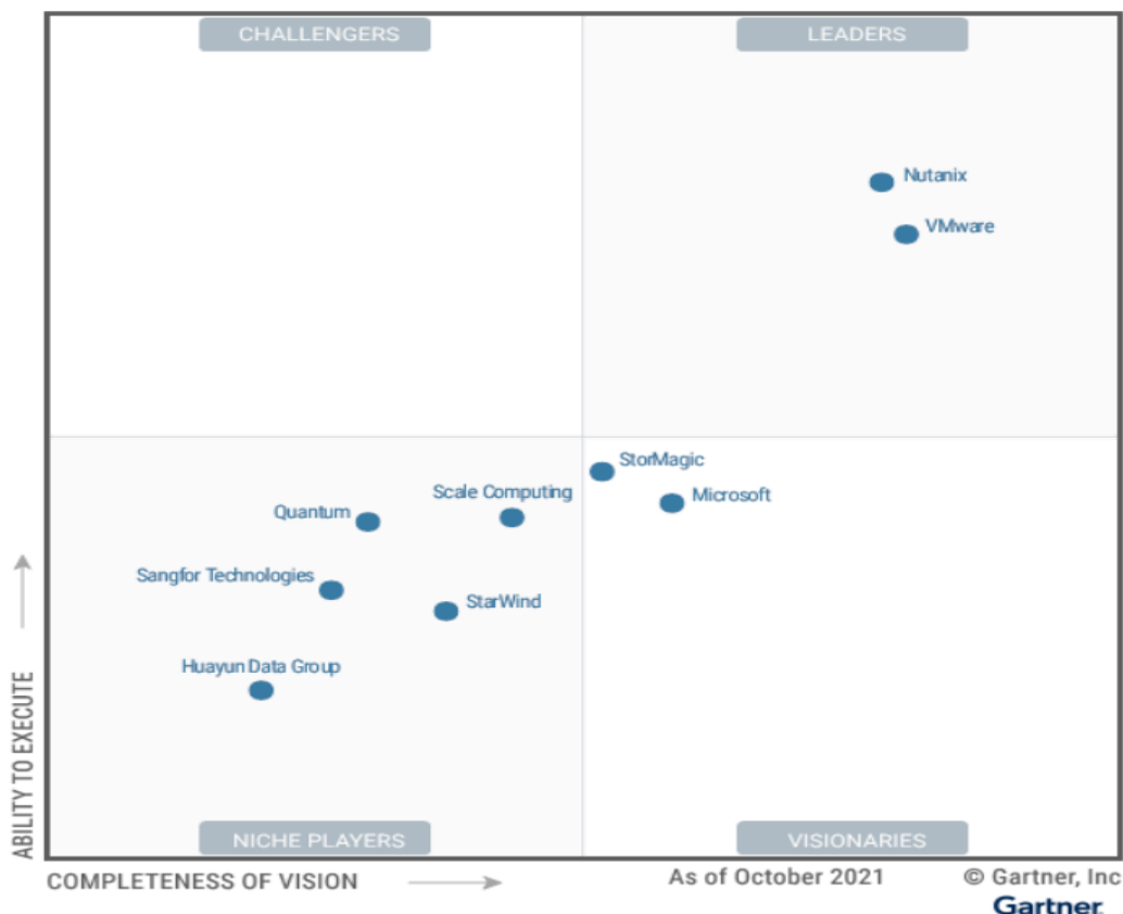
Figure 1: Magic Quadrant for Hyperconverged Infrastructure Software